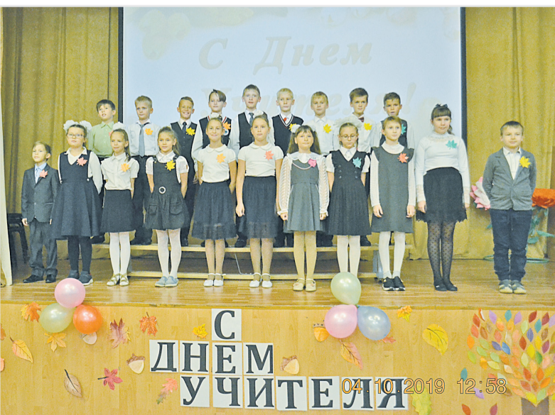
С ДНЕМ УЧИТЕЛЯ 04.10.2019 12:53

По материалам пресс-службы Кировского района